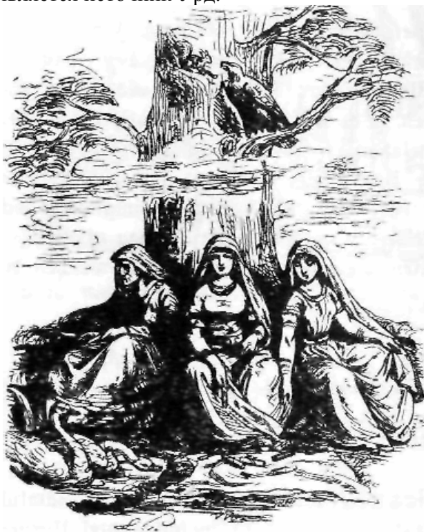
Abb. 23. Die 3 Nornen an der Urdquelle.

Центром мира людей, расположенным у самого основания космической Оси, является источник Урд.