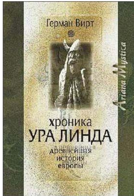
Обложка русского издания