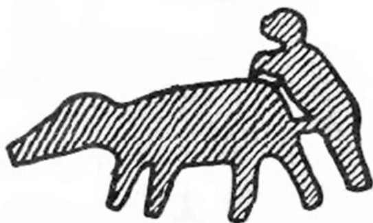
Abb. 50 Sodomitischer Geschlechtsverkehr des Ur-Ebräers mit einem Schwein. Entdeckt von Franz v. Wendrin. Auf Tafel 55, Bild 4, nach E. Balzer: Glyphes des Roches du Bohus.än.

Первый из выделенных нами тезисов доказывался Виландом очень просто: ученый ссылаясь на поразительную находку одного шведского археолога, открывшего на скальные рисунки германцев древностью в 200 000 лет. Работы Берлинского специалиста Франца фон Вендрин 68 лишь подкрепили немецкого ариософа в его догадках и убеждениях. Эти два эпохальных открытия имели для концепции Виланда огромное значение, поскольку позволяли опровергнуть одновременно и предрассудок о «германских варварах», и церковное учение о творении Богом первого человека 5684 года назад. Увеличивая длительность истории, Герман Виланд повышал возраст и уровень германской культуры и находил основания для ее противопоставления культуре негерманской.